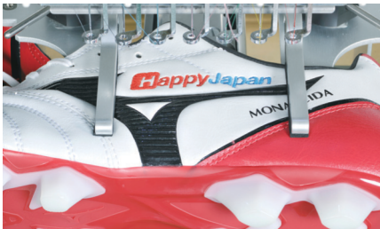
Svorkový rám na boty (60×100mm)