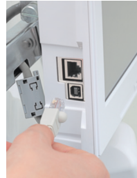
LAN a USB konektivita