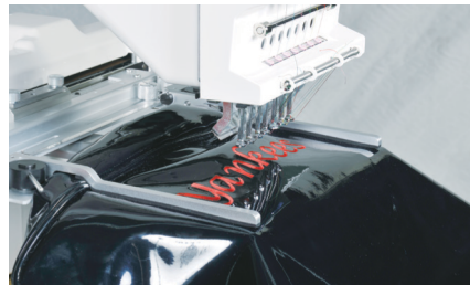
Rám s bočními svorkami (140×220mm)