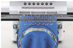
Rámy na čepice