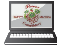
Editační funkce v programu HAPPYLAN/LINK