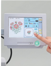
Dotykový panel Paměť na 3 000 vzorů Paměť na 100 000 000 stehů