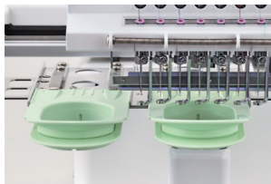
Rámy na ponožky