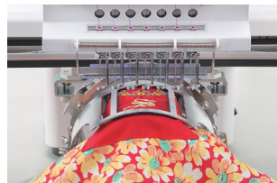
Rámy One Point