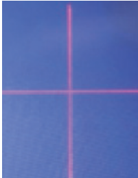
Laserový ukazatel pozice, křížkový