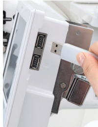
USB a PC myš