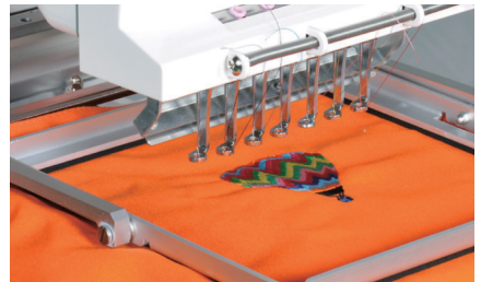
Ruční svorkový rám (Velký: 150×300mm Malý: 150×150mm)