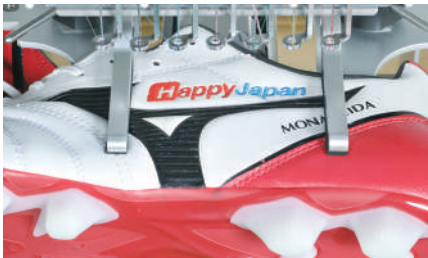
Svorkový rám na boty (60□100mm)