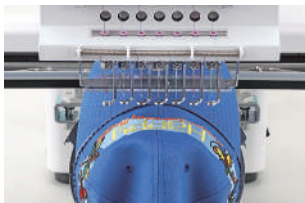
Rámy na čepice