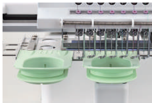
Rámy na ponožky