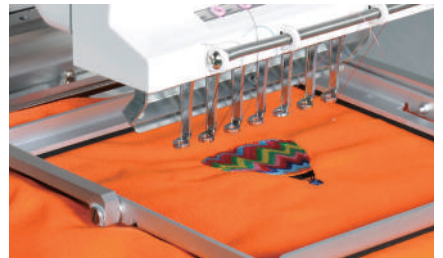
Ruční svorkový rám (Velký:150□300mm Malý:150□150mm)