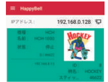
HAPPY BELL Mobilní aplikace pro notifikaci stavu stroje