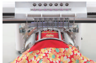
Rámy One Point