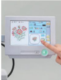
Dotykový panel Paměť na 999 vzorů Paměť na 40 000 000 stehů