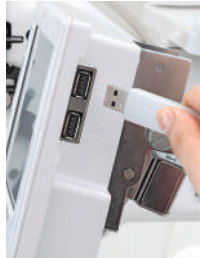
USB a PC myš