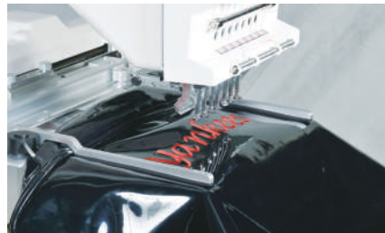
Rám s bočními svorkami (140□220mm)