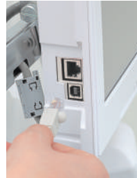
LAN a USB konektivita