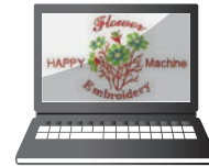
Editační funkce v programu HAPPY LAN/LINK